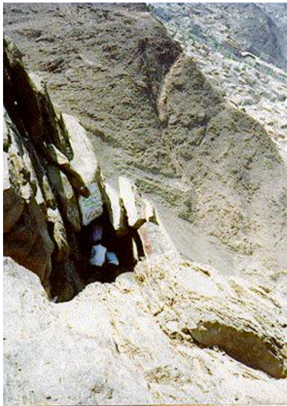
Пещера Хира (вид сверху). Здесь было ниспослано первое откровение.

Мухаммад (мир ему и благословение Аллаха) находился в своей пещере, когда внезапно перед ним возник Ангел Откровения Джабраиль (Гавриил), тот же, что и являлся к Марии матери Иисуса. Ангел схватил Мухаммада, крепко сжал и повелел: «Читай!» Напуганный человек произнес: «Я не могу читать». Ангел еще дважды повторил свой приказ, и Мухаммад отвечал то же самое. Наконец, Джабраил сжал его с невероятной силой, и тогда Мухаммаду был ниспослан первый аят Священного Корана, и он прочитал: