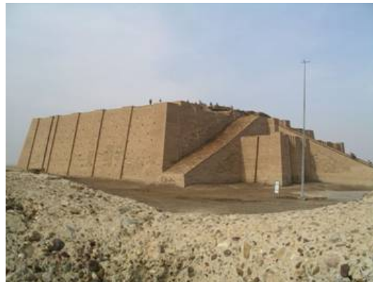
O Grande Zigurat de Ur, o templo do deus lua Nanna, também conhecido como Sin. Tirada em 2004, a fotografia é cortesia de Lasse Jensen.

Descobertas arqueológicas da época de Abraão traçam um retrato vívido da vida religiosa da Mesopotâmia. Seus habitantes eram politeístas que acreditavam em um panteão, no qual cada deus tinha uma esfera de influência. O grande templo dedicado ao deus lua acadiano[10], Sin, era o centro principal de Ur. Haran também tinha a lua como figura divina central. Acreditava-se que esse templo era o lar físico de Deus. O deus principal do templo era um ídolo de madeira com ídolos adicionais, ou 'deuses', para servi-lo.