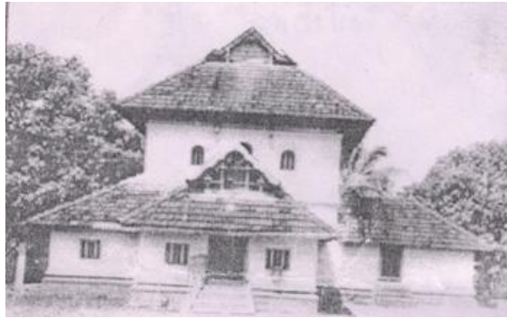
Photo de la Cheraman Juma Masjid, la plus vieille mosquée de l'Inde datant de l'an 629 de notre ère. Cette photo a été prise avant que la mosquée ne soit entièrement rénovée

On rapporte que le contingent du roi était mené par un musulman, Malik bin Dinar, et qu'il continua son chemin jusqu'à Kodungallure, la capitale des Chera, où il construisit la première mosquée de l'Inde, vers l'an 629 de notre ère, laquelle mosquée existe toujours aujourd'hui.